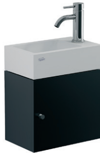
Conjunto mueble con lavatorio YL15A BN