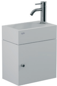
Conjunto mueble con lavatorio YL15A BB